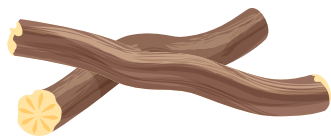
RADICE DI LIQUIRIZIA