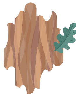
CORTECCIA DI QUERCIA