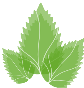
FOGLIA DI ORTICA