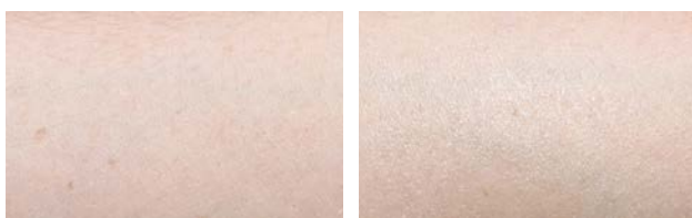
Avambraccio trattato con un gel contenente LUMINESCINE 4% p/p (destra) e una formulazione placebo (sinistra), effetto in piena luce solare

LUMINESCINE è in grado di proteggere dalle dannose radiazioni UV trasformandole in una fonte di luce generata direttamente sulla pelle e i capelli conferendo un aspetto più radioso, brillante, giovane e sano.